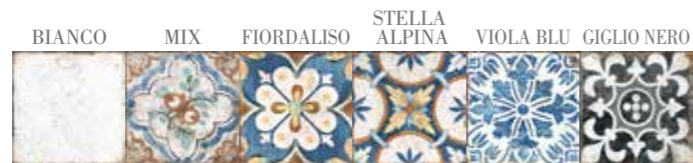
Figure geometriche stilizzate si alternano armoniosamente per comporre tavolozze cromatiche calde e familiari. Il fondo, che si ispira alla pergamena antica, ne sottolinea l'esotismo rendendolo gradevole e gioiosamente abitabile.

effetto cemento concrete-look effet ciment zementoptik